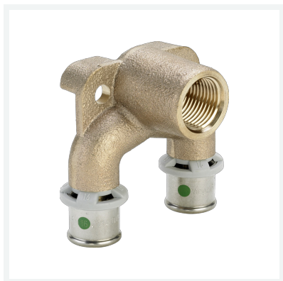
Sanfix P-Doppelwandscheibe mit SC-Contur Modell 2125.7 Artikel 590 208