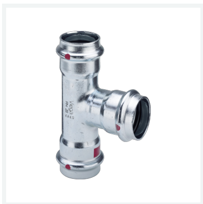
Prestabo-T-Stück mit SC-Contur Modell 1118 Artikel 558 864