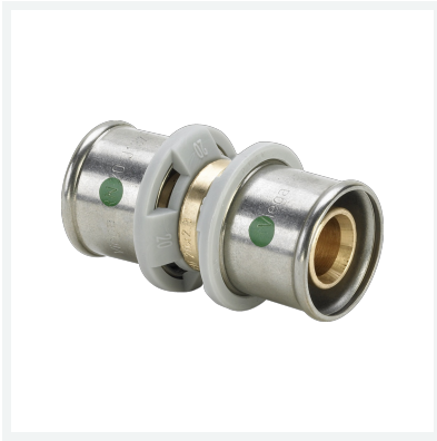
Sanfix P-Kupplung mit SC-Contur - Pressanschlüsse Modell 2115