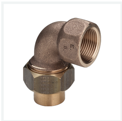
Übergangverschraubung 90° Modell 94096G Artikel 107 338