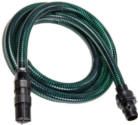
76062 Aspir Flex basic (Kunststofffilter)