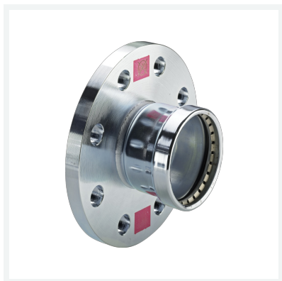
Prestabo XL-Flanschübergang mit SC-Contur Modell 1159XL Artikel 598 211