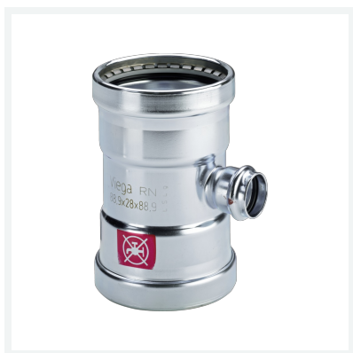
Prestabo XL-T-Stück mit SC-Contur Modell 1118XL Artikel 597 894