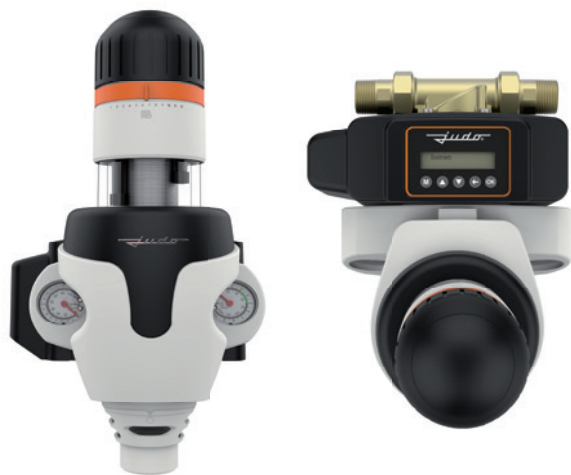
Modell 2022: PROM-i-SAFE ¾" - 1¼"

Bei den Rückspül-Schutzfiltern der Keimschutzklasse wird das Sieb nicht alle sechs Monate getauscht, sondern mit filtriertem Wasser gereinigt. Hier saugen Düsenstrahlrohre die Sieboberfläche Punkt für Punkt mit filtriertem Wasser ab. Gleichzeitig säubern sie das Schauglas. Im Handumdrehen, ohne Unterbrechung der Wasserversorgung, ohne Berührung wasserführender Teile und ohne Abfallberge durch verbrauchte Filterelemente und Verpackungen. Dank der Integration des Mikroleckageschutzsystems erkennt die Gesamtlösung zudem Leckagen und schleichende Wasserverluste und stoppt zuverlässig den Wasserfluss. Außerdem besitzt sie einstellbare Grenzwerte, die sich ganz an Ihre Gewohnheiten und Ihren persönlichen Verbrauch anpassen lassen.