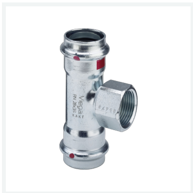
Prestabo-T-Stück mit SC-Contur Modell 1117.2 Artikel 558 987